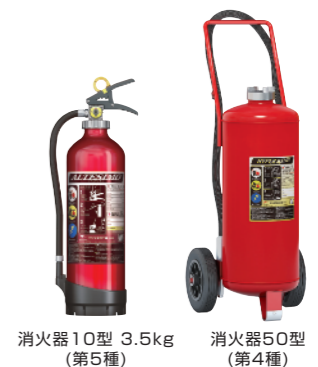
消火器10型 3.5kg (第5種) 消火器50型 (第4種)

セルフサービスステーションは消防法上、「顧客に自ら給油等をさせる給油取扱所」と呼称され、「著しく消火困難な製造所等」に区分されるため、第3種消火設備「スーパーセルフ」に加え、第4種「大型車載式消火器」、第5種「消火器」を規模に合わせて設置する必要があります。各種取り揃えておりますので、併せてご用命ください。